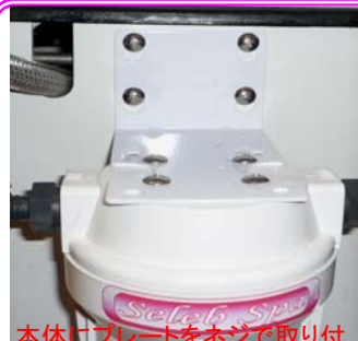
本体にプレートをネジで取り付け任意の場所にネジ又は両面テープで本体を固定します。