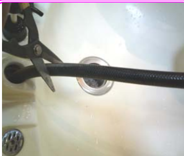
シャワーホースを適当な位置で切断します。

注意 : 2年に一度逆流洗浄をしてください。取り外してIN/OUTを逆に取付け、10分程度捨て水をしてから元に戻してください。