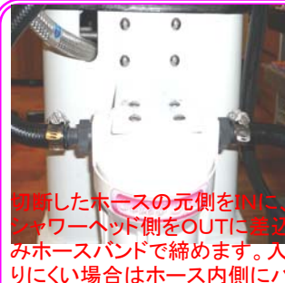
切断したホースの元側をINに、シャワーヘッド側をOUTに巻き込みホースバンドで締めます。入りにくい場合はホース内側にハンドクリーム等を塗布すると入り易くなります。