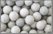
ラジウムセラミックス

ラジウムセラミックスは人体に影響がない適度な放射線を発生し続けています。このセラミックスは水に電荷(電子)と遠赤外線をさらに増幅させ体内、肌、髪などの細胞に働きかけ、老化を効果的に修復する作用があると云われています。(例:温泉効果)